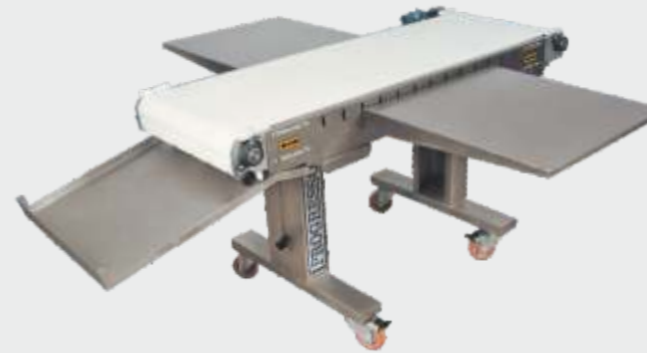
ED-1 ( 2 mesas laterais - 170 x 55 x 95 cm).

Virador automático de massa, malha de moldagem e trem de engrenagens para pães de forma. (opc) Esteira de alimentação longa com 220 cm de comprimento. (opc)