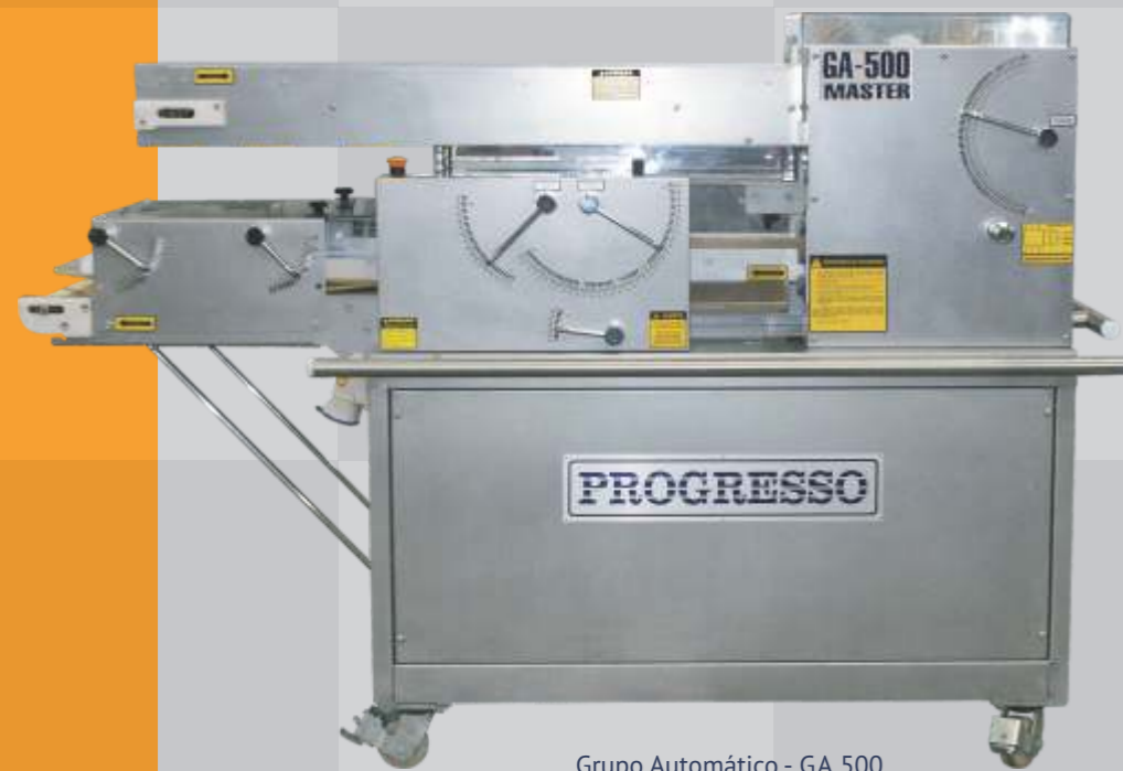
Grupo Automático - GA 500