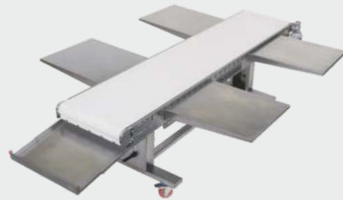
ED-2 ( 4 mesas laterais - 270 x 55 x 95 cm),

Esteira de distribuição de altura regulável acoplada a esteira de saída com capacidade para trabalho de até quatro pessoas ao mesmo tempo para colocação dos pães nas assadeiras. Mesas laterais dobráveis que podem ser colocadas em qualquer ponto ao longo da esteira.