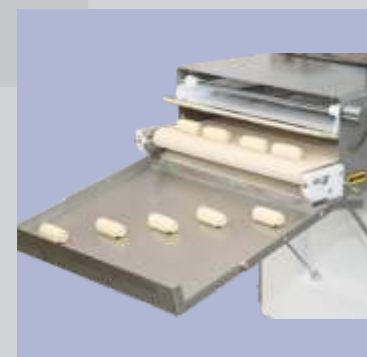
Pães franceses / hotdogs