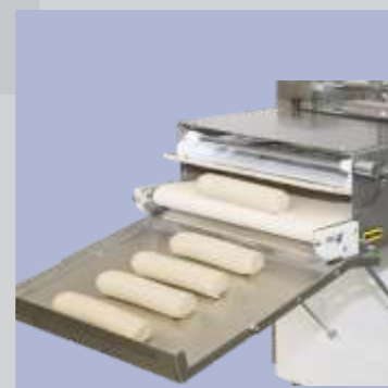
Pães de forma