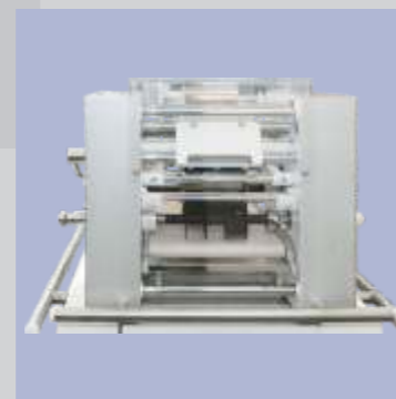
Grupo de corte a 3 vias