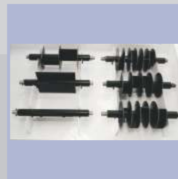
6 divisores de corte